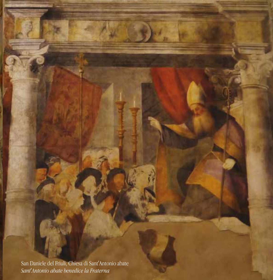
San Daniele del Friuli, Chiesa di Sant'Antonio abate Sant'Antonio abate benedice la Fraterna

San Daniele del Friuli, Biblioteca Guarneriana