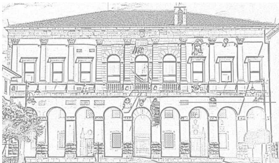
Museo Archeologico Nazionale di Cividale del Friuli Orario di apertura: lunedì: 9:00 - 14:00; martedì/domenica: ore 8:30 - 19:30 Biglietto d'ingresso: 4 euro (gratuito fino a 18 anni)

Fondato nel 1817, il Museo ha sede nel cinquecentesco Palazzo dei Provveditori Veneti. La collezione del Museo racconta nelle sale del piano terra la storia della città, dal municipio di età romana fino al periodo della dominazione veneziana. Le tappe sono scandite dagli splendidi mosaici provenienti dalle domus , dalle lettere scolpite nelle iscrizioni pubbliche e dalle sculture provenienti dalle chiese e dai palazzi della Cividale medievale. Il piano nobile ospita la ricchissima sezione longobarda, una mirabile sequenza di oggetti provenienti dalle necropoli di Cividale e del suo ducato, che racconta il fascino e la particolarità della cultura dei Longobardi e tramanda l'importanza del loro contributo nella formazione dell'Italia medievale.