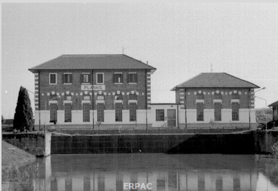
Idrovora del Planais

Gli interventi sui terreni paludosi e malsani della bassa pianura friulana hanno infatti radici lontane, risalenti all'epoca romana, quando furono eseguiti i primi grandi interventi idraulici.