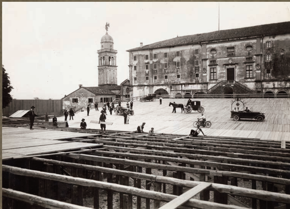
Studio Pignat, Udine, Colle del Castello, Teatro all'aperto, palcoscenico per la rappresentazione dell'Atta, 1923, CNU, Foto staccabile.

La S. V. è invitata alla presentazione della mostra e del catalogo