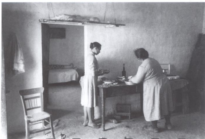
Melissa, un paese della Calabria, 1963