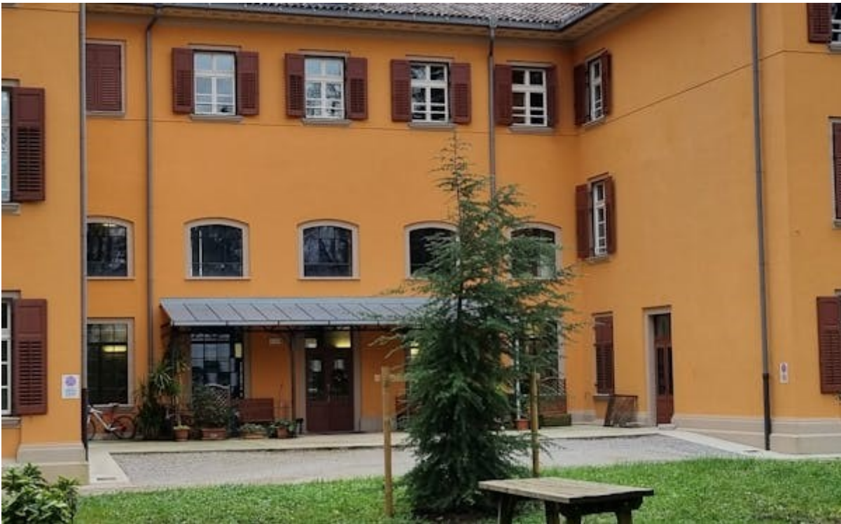
L'ARCHITETTURA SI TRASFORMA: DAL MANICOMIO AL PARCO BASAGLIA