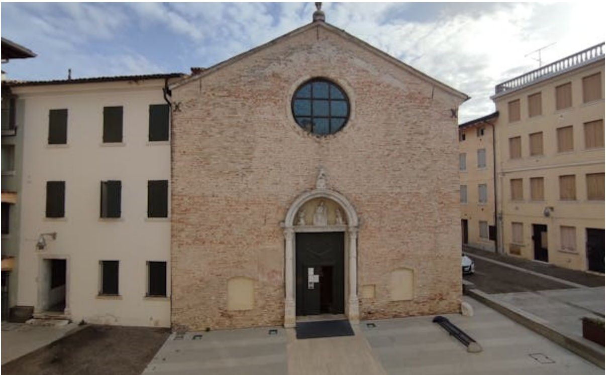
CHIESA DEL CRISTO