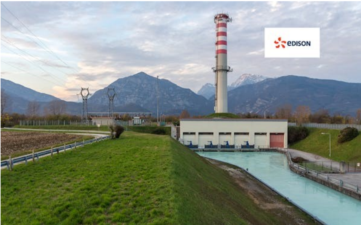
CENTRALE IDROELETTRICA EDISON DI PONTE GIULIO