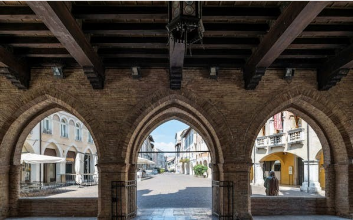
MUNICIPIO DI PORDENONE