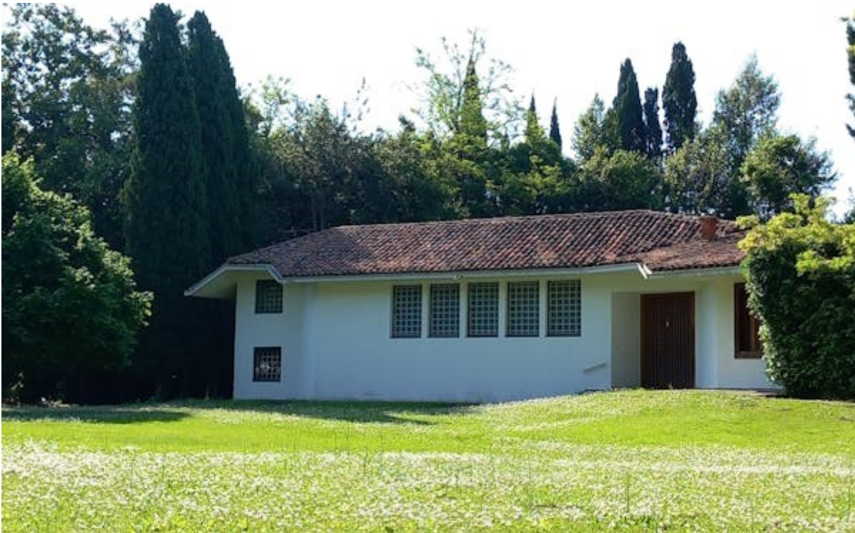
SALA CONSILIARE DEL MUNICIPIO DI CERVIGNANO DEL FRIULI