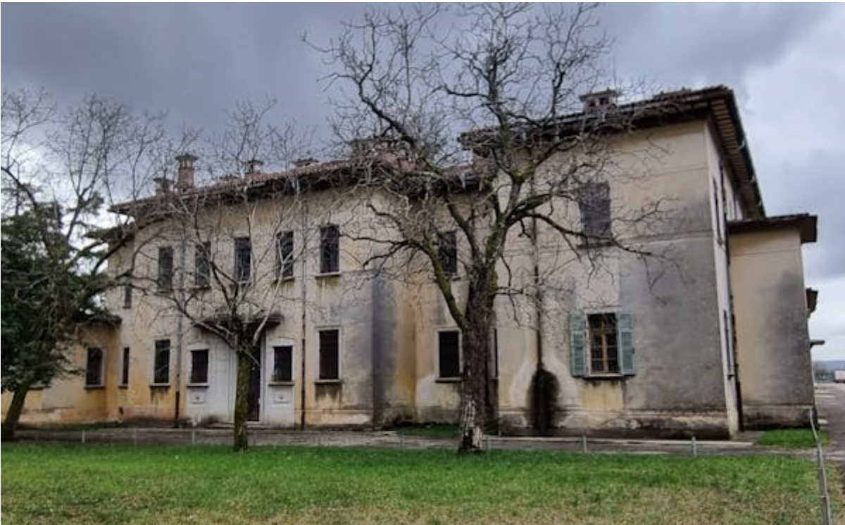
PALAZZINA B - REPARTO AGITATI (SOLO ESTERNO)