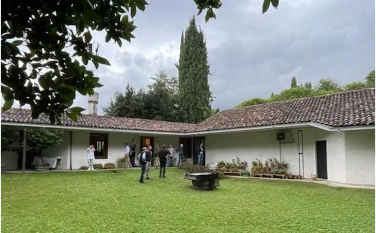
CASA-STUDIO DEL PITTORE GIUSEPPE ZIGAINA