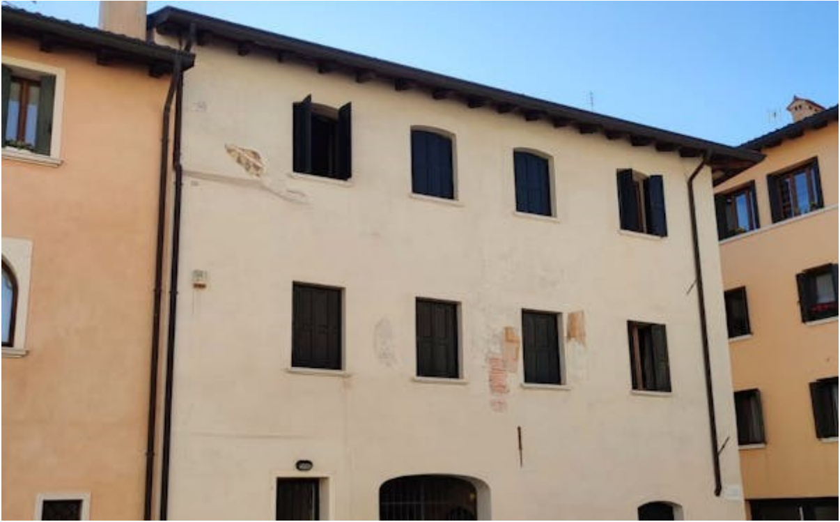
ANTICO OSPITALE DEI BATTUTI