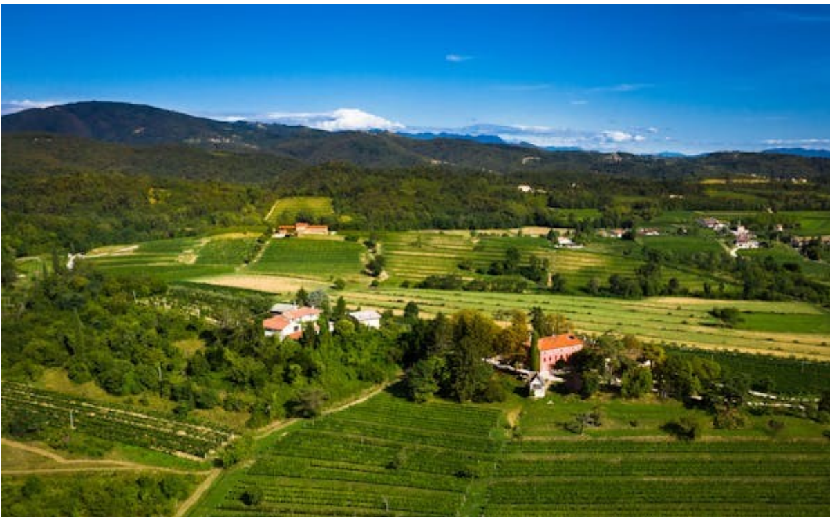
CASA "DOMENICALE" SPEZZOTTI - STROPPOLATINI