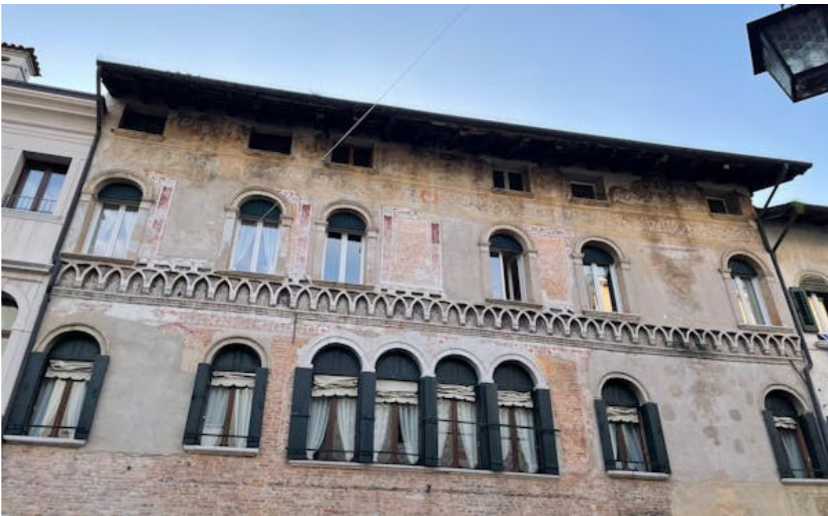
PALAZZO MANTICA - CATTANEO