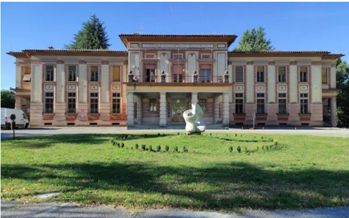
PARCO BASAGLIA: VOCI DAL MEZZOMONDO