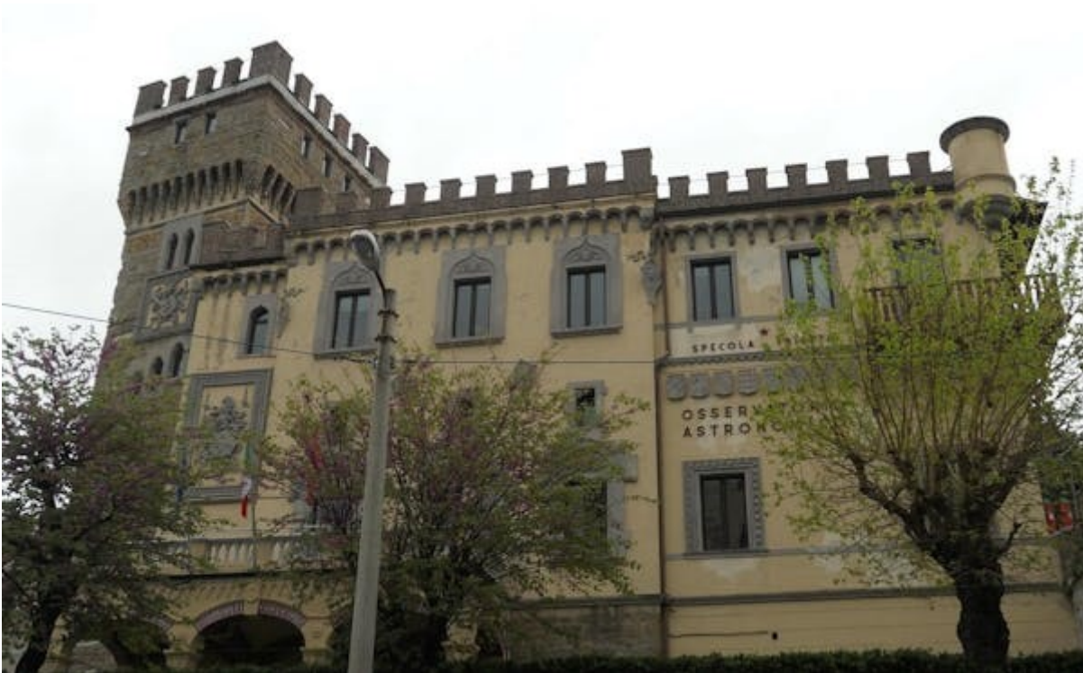
OSSERVATORIO ASTRONOMIC DI TRIESTE