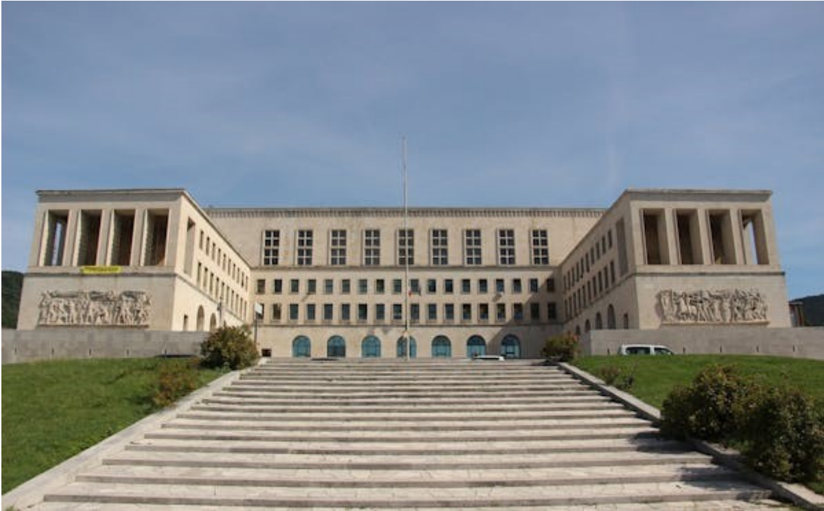
SEDE DELL'UNIVERSITÀ, PINACOTECA DEL RETTORATO, MOSTRA SBLAD