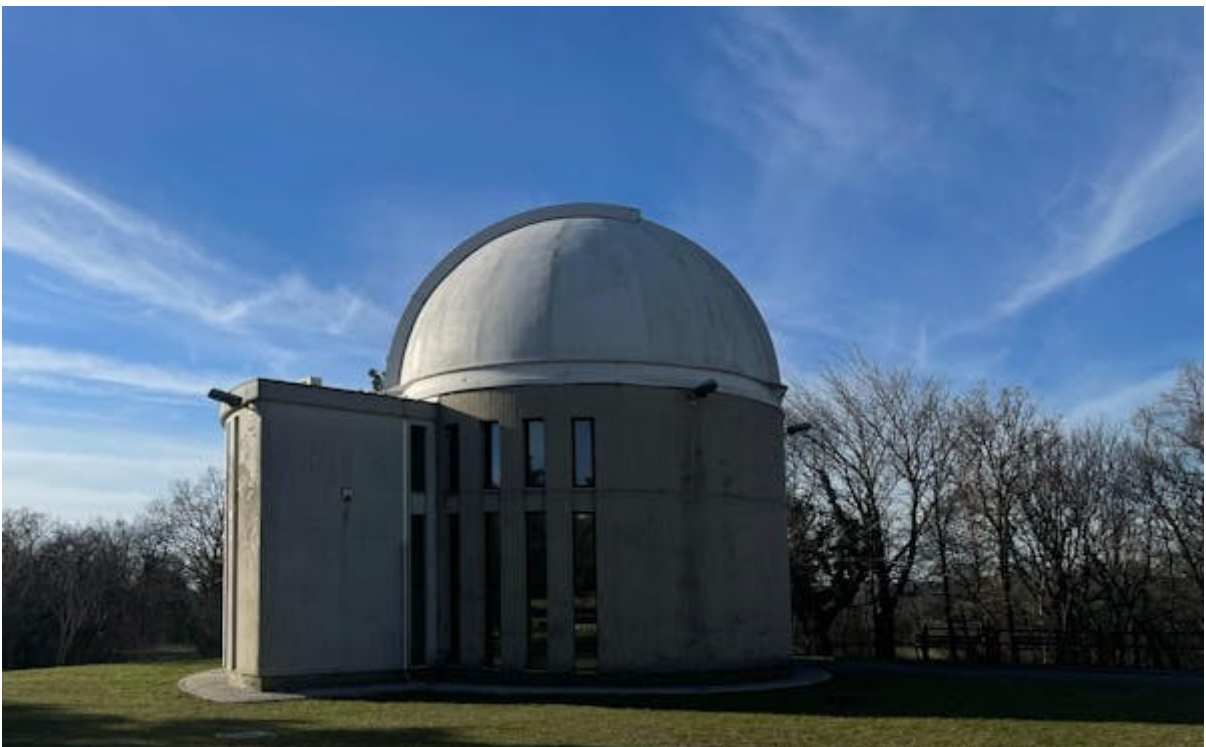
SPECOLA MARGHERITA HACK