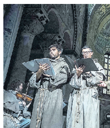
CONCERTI Tante proposte