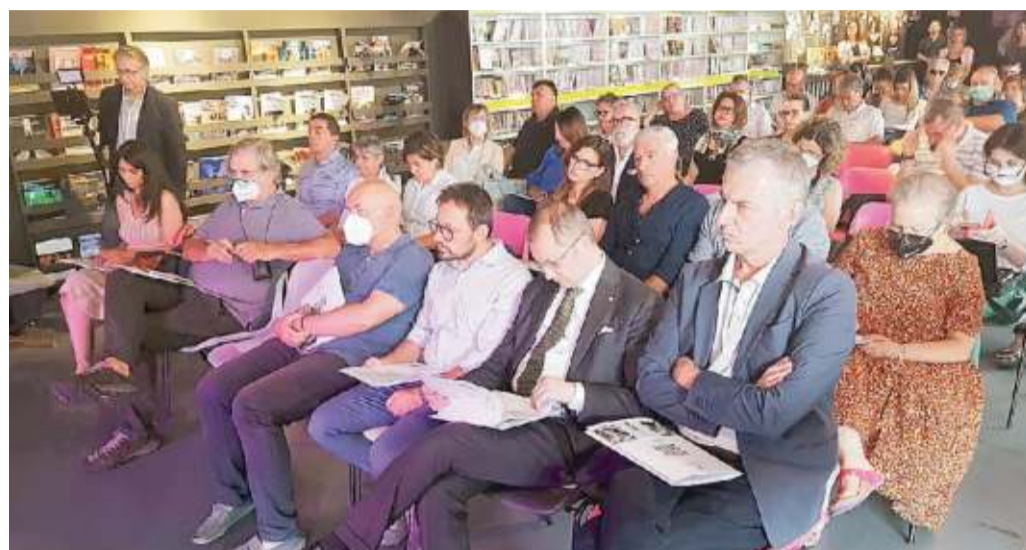
I partecipanti al convegno della Fondazione Friuli tenutosi al Bookshop del Visionario a Udine