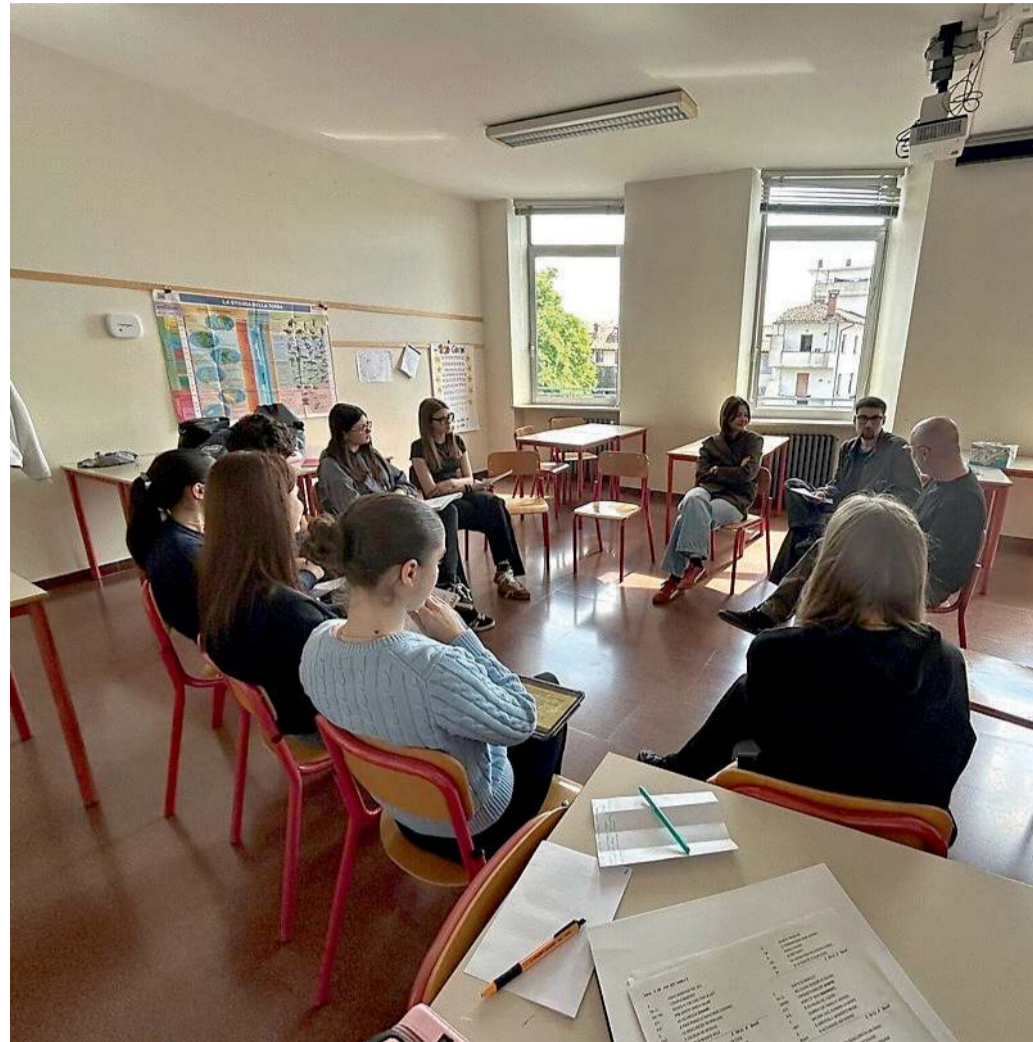
Una classe del liceo Percoto che partecipa al progetto Rondine

L'inquietudine è diventata un cammino per crescere e affrontare le sfide e le tensioni del nostro tempo