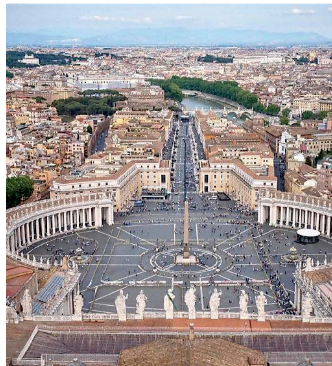
La Basilica di San Pietro in Vaticano

Nonostante le divergenze dogmatiche e le diverse interpretazioni della divinità, esiste un filo invisibile che lega tutte le