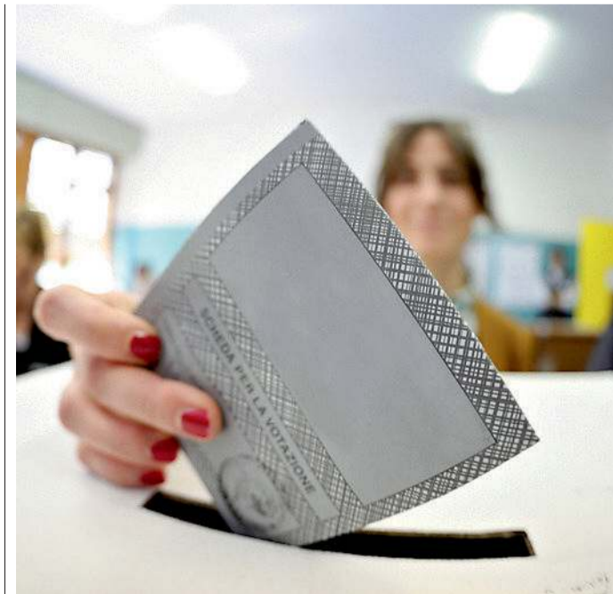
Una ragazza al momento del voto in un seggio