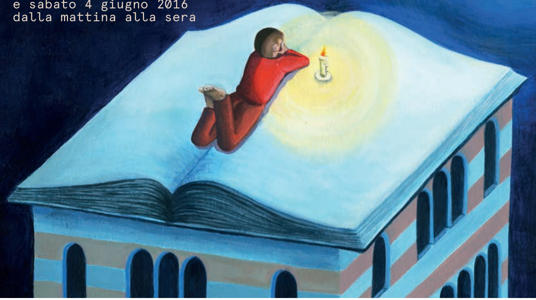
Illustrazione: Sergio Monaco