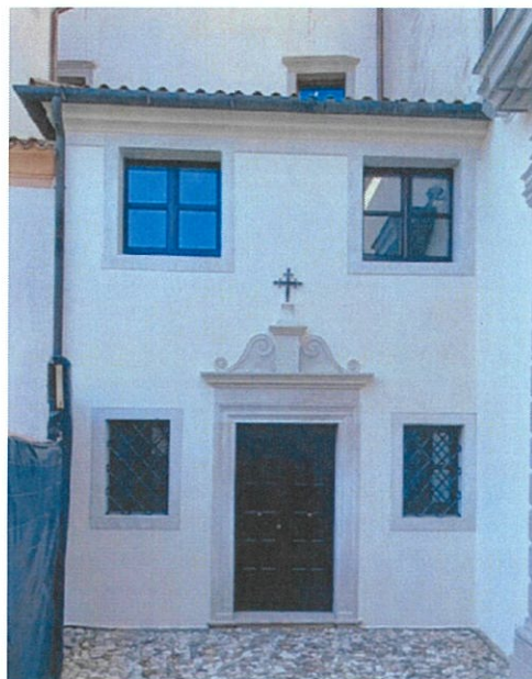
Portale rivolto al cortiletto interno ante e post