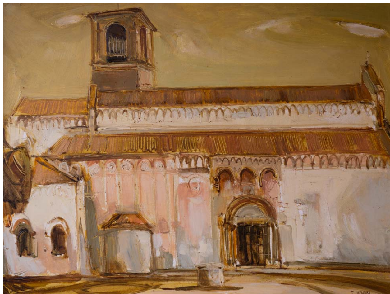
Il Duomo di Spilimbergo, dipinto da Toni Menossi

«Cantore di una friulanità istintiva» lo definì il critico d'arte Licio Damiani , «Menossi è un artista da riscoprire per la sua sincerità, per la sapienza tecnica e la capacità di innovare il modo di guardare al paesaggio e alle sue radici naturalistiche», commenta oggi la storica dell'arte Francesca Venuto . Toni Menossi nacque nell'allora periferia di Udine, in viale Vât. Uscito dall'esperienza giovanile nelle file della Resistenza con la X