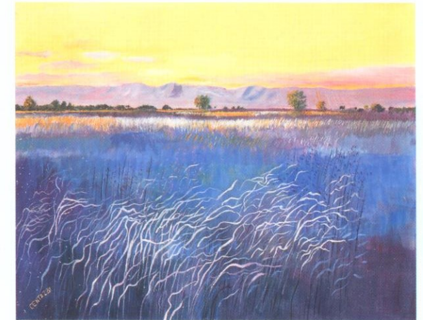
“Tramonto sui Magredi” olio su tela, cm 70x60 - 2015