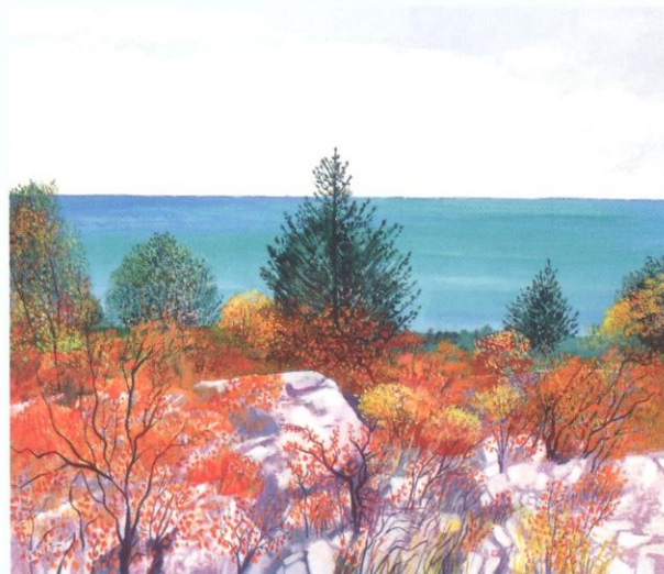
“Riviera carsolina” olio su tela, cm 70x60 - 2015

Chi scrive, tanti anni fa, ha avuto modo di condividere con lui responsabilità amministrative nel Comune di S. Michele al Tagliamento, e serba il gradito ricordo della sua serietà e competenza, integrate, all'occorrenza, da una buona dose di giusta determinazione.