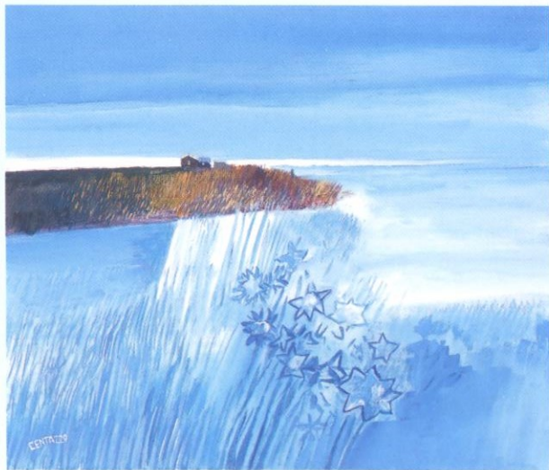
“Casoni in controluce” olio su tela, cm 70x60 - 2015

Il risultato è la traduzione in immagini e versi del loro atteggiamento nei confronti del tema affrontato: storia, natura e sogno convivono assieme, in un continuo rincorrersi di suggestioni visive e concettuali, con le quali manifestano agli altri momenti di vita vissuti, emozioni provate, sguardi tra realtà e