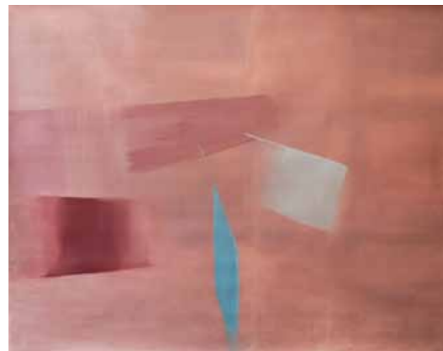
Maddalena Granziera, Da consumarsi preferibilmente entro , 2015. Olio su carta, cm 119x152.

Dunque dovrebbe essere chiaro che alla critica d'arte (rivista e corretta secondo quanto sopra) spetta un compito non trascurabile, ovvero quello di un confronto serrato ma aperto con la mutevolezza e l'inafferrabilità del presente per metterne in luce sia i caratteri di continuità rispetto al passato più prossimo, sia i caratteri innovativi e originali, pur nella consapevolezza che anche nell'ambito della creatività nulla nasce da nulla. Ne discende che la critica d'arte ha (o dovrebbe avere) il mandato di