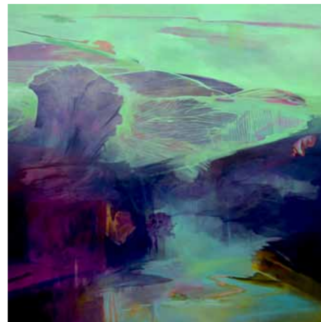
Alessio Guarda, Vedo colline di altri colori , 2016. Olio su tela, cm 120x120.

esplorare una realtà in continuo divenire, di percorrere territori ancora ignoti o poco noti per riferire infine di quanto osservato, di quanto scoperto e di conseguenza essa dovrebbe promuovere la conoscenza dei dati tratti da tale esplorazione perché ne scaturiscano quelle relazioni pubbliche per immagini che comunemente si chiamano mostre.