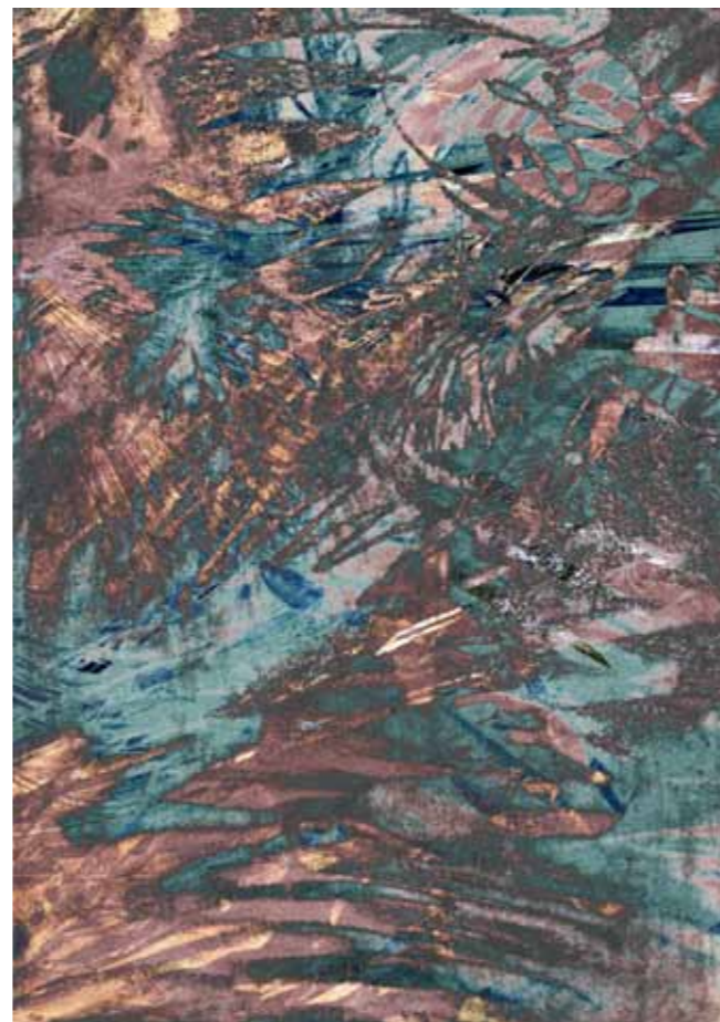
Alex Ortiga, Una cosa visibile agli occhi, una cosa invisibile agli occhi , 2016. Collage digitale di foto, disegni e pittura stampato su lastra PVC, cm 100x70.