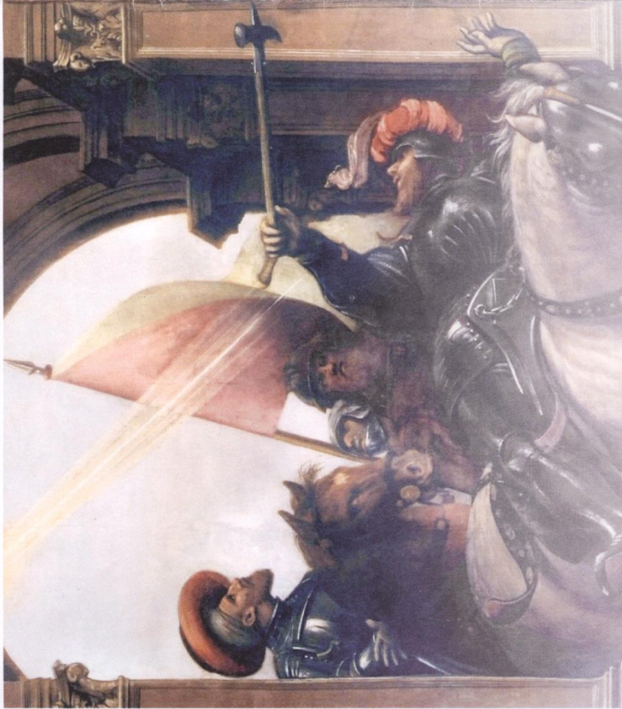
Giovanni Antonio de' Sacchi detto il Pordenone, Conversione di Saulo, 1524

Associazione Musicale "Vincenzo Colombo" Pordenone