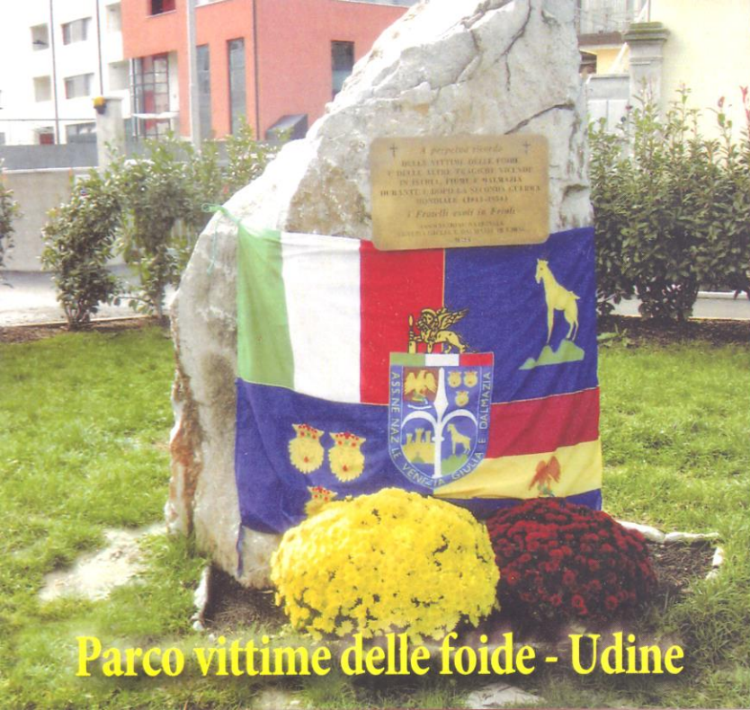
Parco vittime delle foide - Udine

† A perpetuo ricordo † DELLE VITTIME DELLE FOIBE E DELLE ALTRE TRAGICHE VICENDE IN ISTRIA, FIUME E DALMAZIA DURANTE E DOPO LA SECONDA GUERRA MONDIALE (1943-1954)