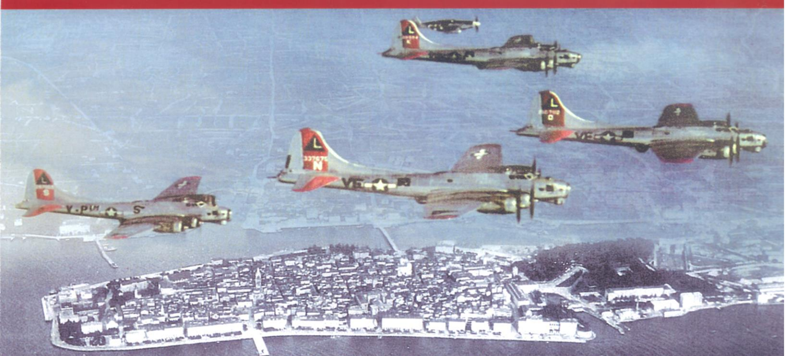
Fortezze volanti su Zara "1943-1944"