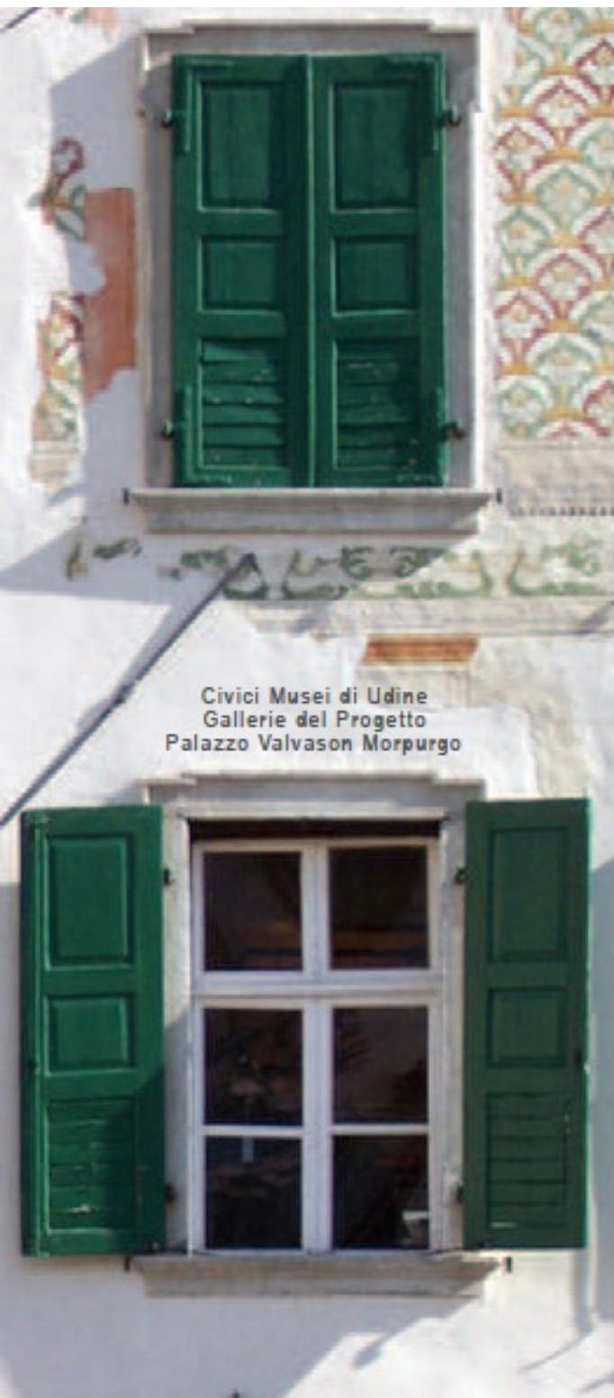
Civici Musei di Udine Gallerie del Progetto Palazzo Valvason Morpurgo

Tra il 1898 e il 1938 Giovanni Battista della Porta (1873-1954), erudito udinese e appassionato studioso della storia della città, lavora negli archivi cittadini, riordinando migliaia di riferimenti alle case comprese entro la quinta cerchia di mura, secondo la numerazione assegnata dal Comando dell'Esercito napoleonico nel 1801 e riportata nella Mappa della R.a Città di Udine , redatta a metà Ottocento da Antonio Lavagnolo. Negli anni della celebrazione del millenario della città, il manoscritto diventa un'opera a stampa, le Memorie su le Antiche Case di Udine , a cura di Vittoria Masutti, per i tipi dell'Istituto per l'Enciclopedia del Friuli Venezia Giulia, opera finanziata dalla Banca del Friuli.