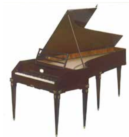
Fortepiano, copia moderna ad opera di un laboratorio di Salisburgo del celebre costruttore Anton Walter a Vienna nel 1790.