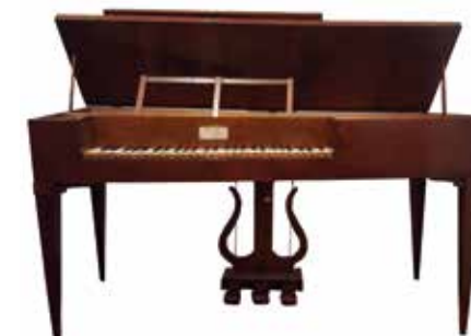
Fortepiano italiano da tavolo costruito da Luigi Rasori a Bologna nel 1832, attualmente uno degli strumenti più antichi di tutta la regione e l'unico esemplare a montare la Prellmechanik.