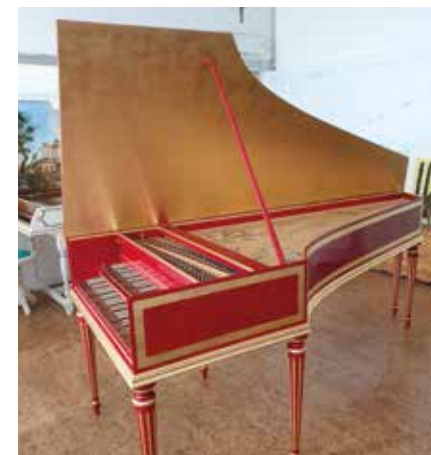
Clavicembalo da modello francese a due tastiere realizzato su progetto originale dalla ditta Fratelli Leita.