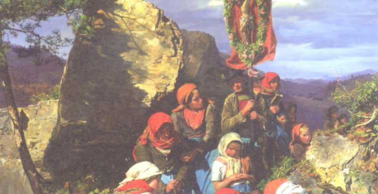
Ferdinand Georg Waldmüller, Il malore del pellegrino (dettaglio) , 1859, Leopold Museum, Vienna.