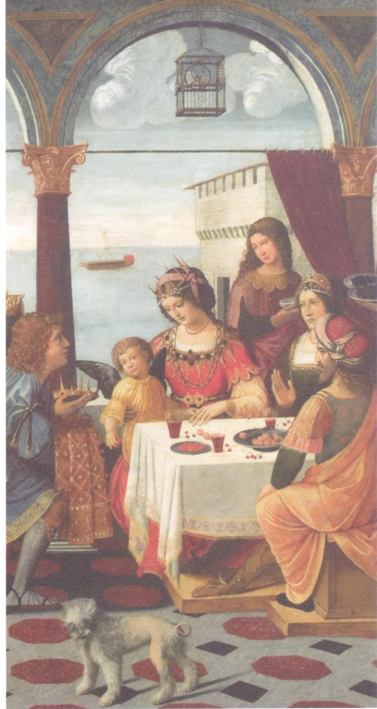
Bernardino de' Donati, Enea alla corte di Didone (dettaglio) , 1520 ca., Museo Borgogna, Vercelli.