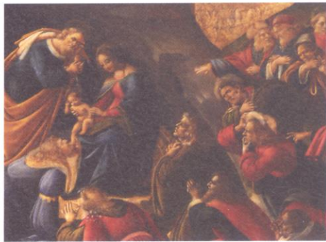
Sandro Filipepi detto Botticelli, Adorazione dei Magi (dettaglio), 1500 ca Galleria degli Uffizi, Firenze.