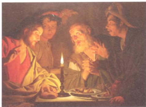
Matthias Stomer, Cena in Emmaus, 1633-1637 Museo Nazionale di Capodimonte, Napoli.