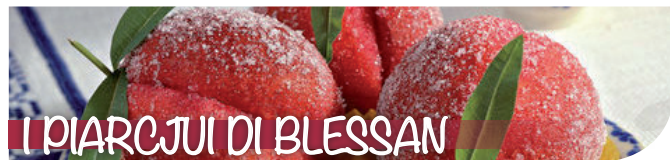
I PIARCJUI DI BLESSANO

Anche quest'anno la cucina di "Danzando tra i popoli..." vi propone un assaggio di sapori tipici che la cucina dei gruppi ospitati ci offre; il tema che abbiamo voluto abbracciare ci ha portato a scegliere questi piatti che meglio lo rappresentano: