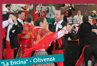
"La Encina" - Olivenza