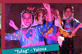
"Tufag" - Yalova