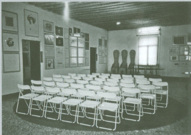
Un interno del Museo Casabianca