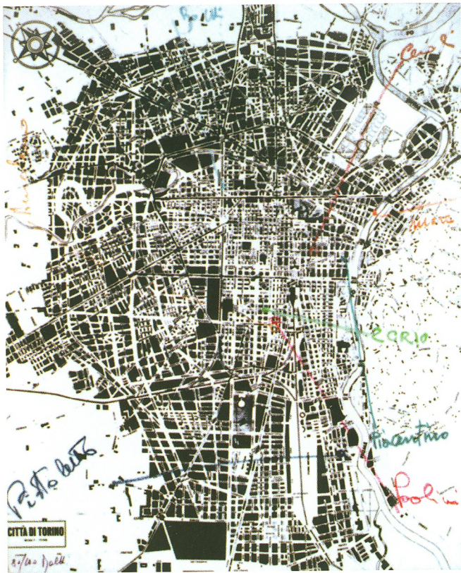
Alighiero Boetti, Città di Torino , 1968, eliografia, 56x46 cm

Piramidi del 1986) che si affidano da un lato ad una sorta di tessitura ottenuta con trame di segni che danno vita a reticoli articolati e vibranti, continue modulazioni di possibilità che sono intrinseche al segno adottato e allo spazio su cui il segno medesimo opera; dall'altro all'uso di colori piatti e primari, usati con la stessa logica dei segni: non per nulla è notissima affermazione dell'artista che "anche un cieco può fare arte", nel senso che la progettazione può essere totalmente mentale, e l'esecuzione, siccome perfettamente determinata nei particolari, affidata ad altri.