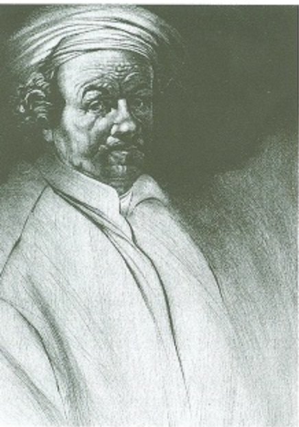
not, 1990, ps., mm 501x401

la potenza dell'incedere del cavaliere. di Rembrandt sono ripresi soprattutto i ritratti della zia, nei quali il pittore si considera con occhio sempre problematico.