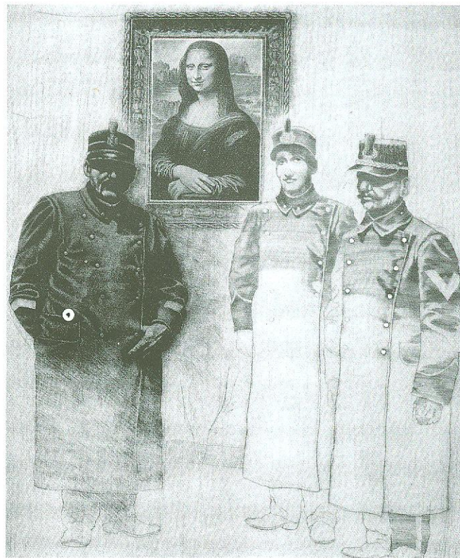
La Gioconda recuperata dai carabinieri, 1982, ps. mezzotinta e fotoincisione, mm 601x501

che genere di realtà Dugo tematizzi, in che modo si pongano i suoi interrogativi e anche le sue soluzioni estetiche.