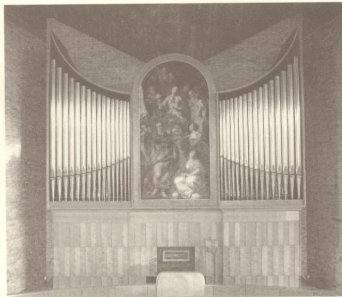
Organo GUSTAVO ZANIN (1989)

(30 note, ambito Do-Fa) 18 - Contrabbasso 16' 19 - Basso forte 20 - Basso dolce 21 - Subbasso 22 - Fagotto 23 - Clarone